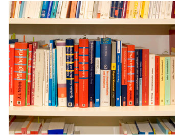
Pflege wissenschaftlich fundiert

Absolventinnen und Absolventen des Studiengangs finden vielfältige Tätigkeitsfelder: In Einrichtungen der pflegerischen oder der gesundheitlichen Versorgung, zum Beispiel in Leitung und Management von Krankenhäusern, Reha-Einrichtungen, Altenheimen und anderen ambulanten oder stationären pflegerischen Einrichtungen. Sie können in Institutionen oder in beruflicher Selbstständigkeit Aufgaben der Beratung oder Sachverständigen Tätigkeit übernehmen bzw. als Experten bei Kranken-/Pflegeversicherungen, dem Medizinischen Dienst oder in der öffentlichen Gesundheitsverwaltung arbeiten. Sie finden Tätigkeiten in Einrichtungen der Aus- Fort- und Weiterbildung im Gesundheitswesen, pharmazeutischen Firmen, oder als Lektoren in Fachbuchverlagen. Die pflege- und gesundheitsbezogene Forschungstätigkeit stellt ebenfalls ein weiteres Tätigkeitsfeld dar. Der Bachelor-Abschluss qualifiziert die Absolventinnen und Absolventen für einen weiterführenden Master-Studiengang.